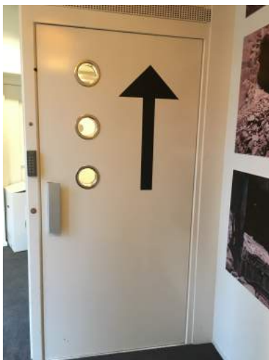
De lift naar ons kantoor

De entree is aan de zijkant. Vanwege de dikte van de muren kon hier geen trap gerealiseerd worden. Daarom moet u, na aanbellen, met een kleine lift naar boven. Even geduld dus, maar dan staat de koffie of thee klaar!